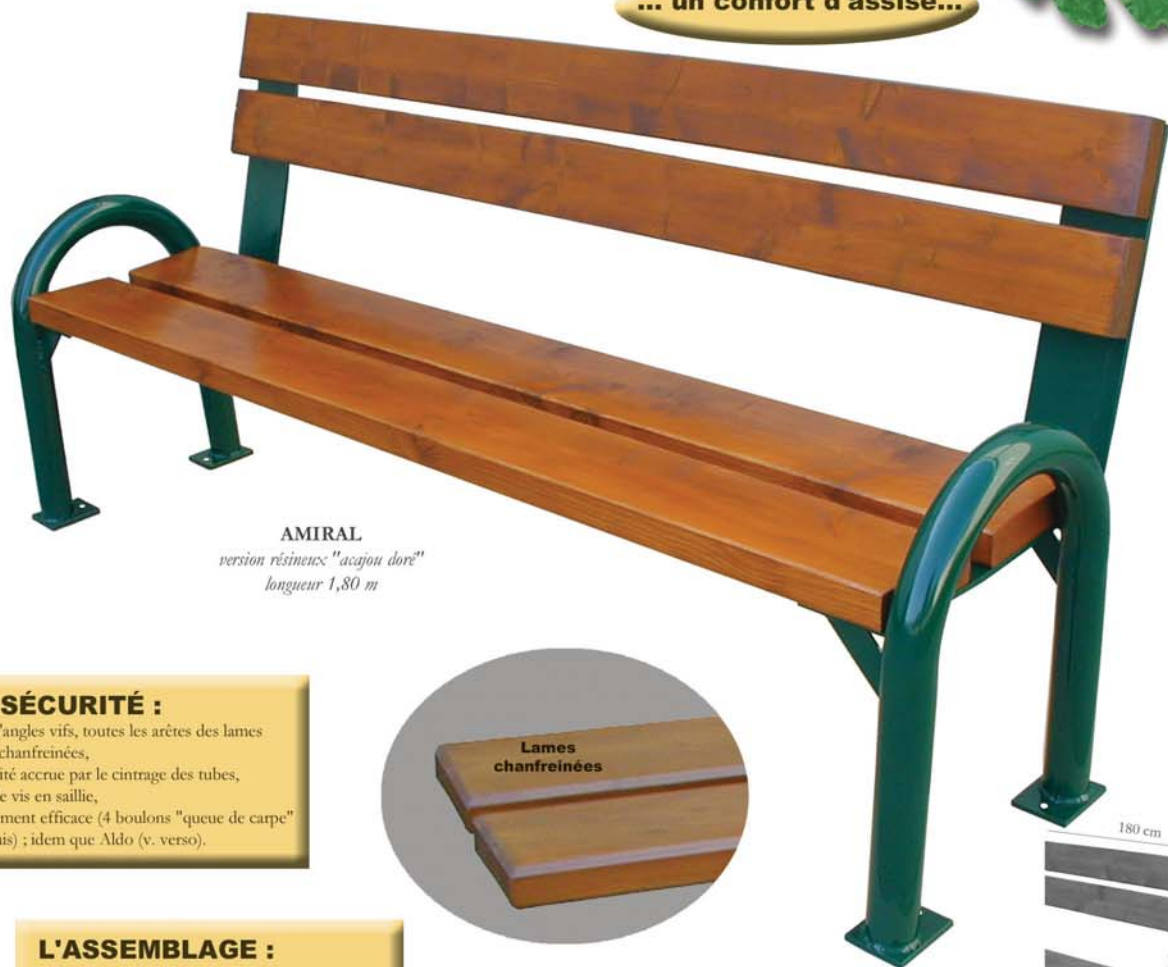
AMIRAL version résineux "acajou doré" longueur 1,80 m

LA SÉCURITÉ : . pas d'angles vifs, toutes les arêtes des lames sont chanfreinées, . sécurité accrue par le cintrage des tubes, . pas de vis en saillie, . scellement efficace (4 boulons "queue de carpe" fournis) ; idem que Aldo (v. verso).