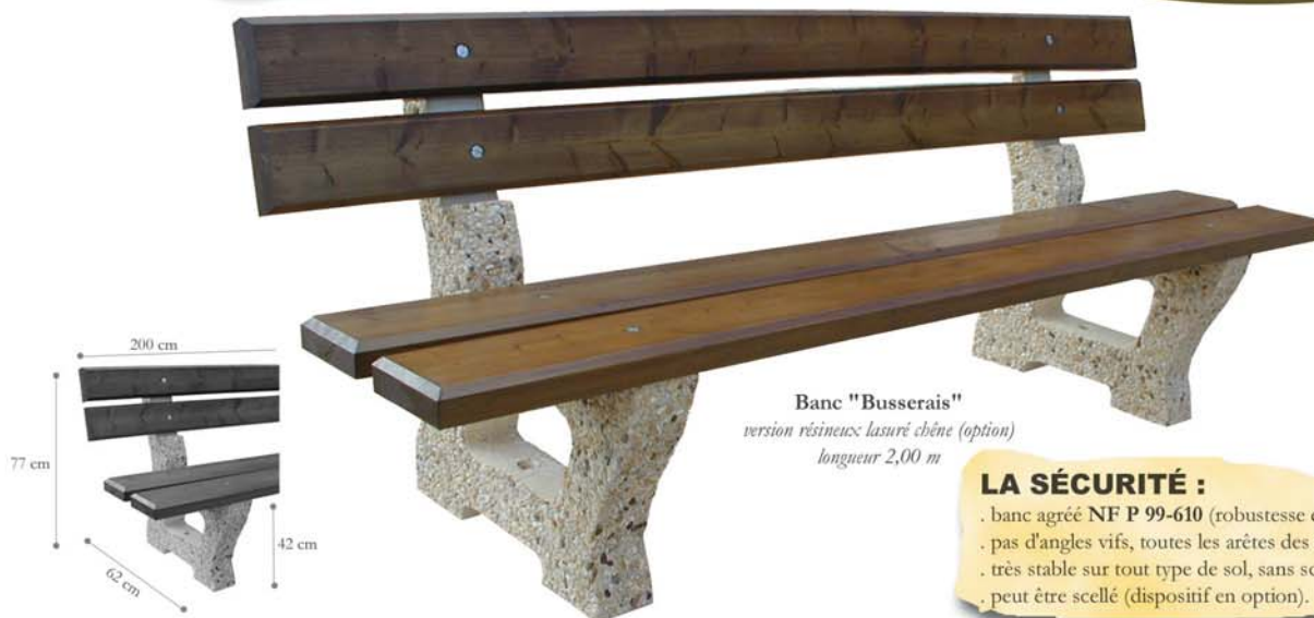
Banc "Busserais" version résineux lasuré chêne (option) longueur 2,00 m