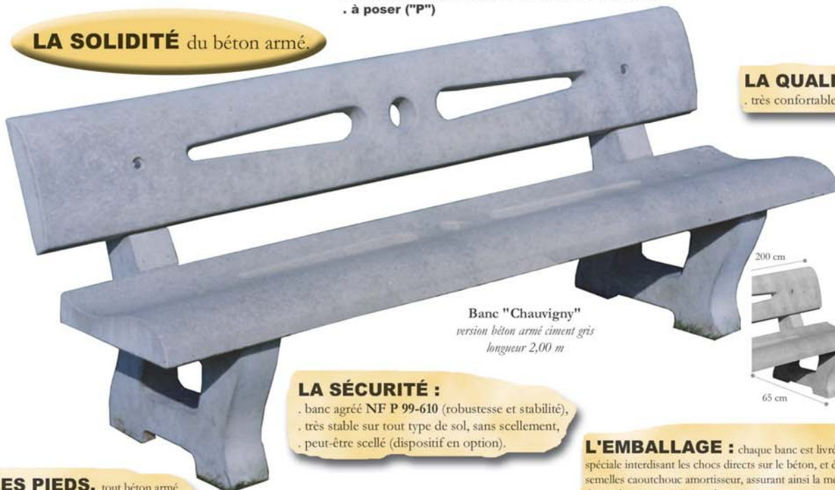
Banc "Chauvigny" version béton armé ciment gris longueur 2,00 m