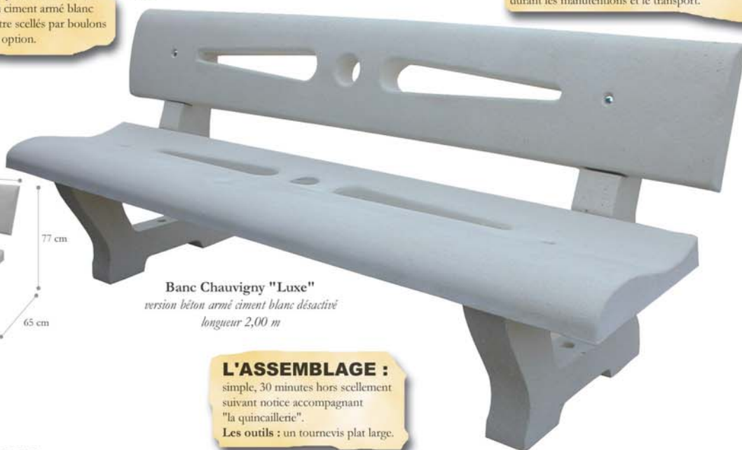
Banc Chauvigny "Luxe" version béton armé ciment blanc désactivé longueur 2,00 m

LES PIEDS, tout béton armé (ciment armé gris ou ciment armé blanc désactivé) peuvent être scellés par boulons "queue de carpe" en option.