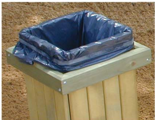
Sac mis en place avec sandow de maintien. Son fond repose sur le sol.