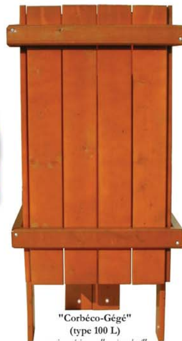
"Corbéco-Gégé" (type 100 L) version résineux: "acajou doré"

sont traités en autoclave sous forte pression, en station référencée par le Centre Technique du Bois et sont labellisés CTB.BOIS + (classe 4 pour l'ensemble des lattes qui reposent sur le sol). Ces bois peuvent rester tel quel, c'est la version "naturel de traitement", ou peuvent être lasurés en coloris standard ou coloris au choix en option.