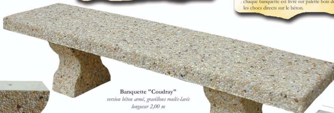
Banquette "Coudray" version béton armé, gravillons roulés-lavés longueur 2,00 m

· chaque banquette est livrée sur palette bois débordante interdisant les chocs directs sur le béton.