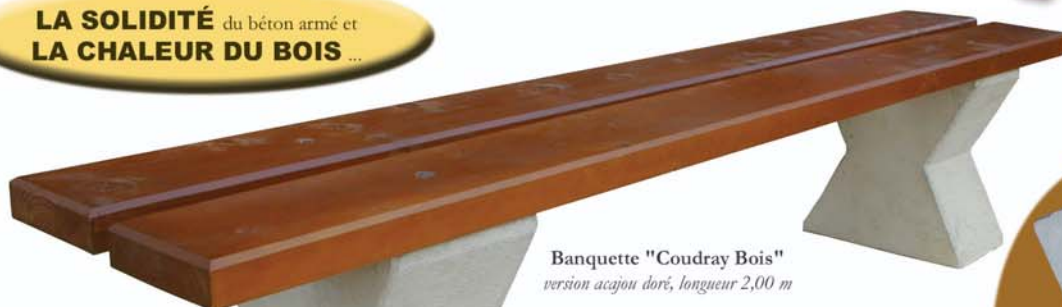
Banquette "Coudray Bois" version acajou doré, longueur 2,00 m