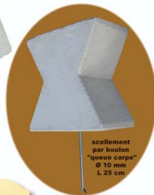
scellement par boulon "queue carpe" Ø 10 mm L 25 cm

L'ASSEMBLAGE : 30 minutes, hors scellement, suivant notice accompagnant "la quincaillerie". Les outils : un tournevis.