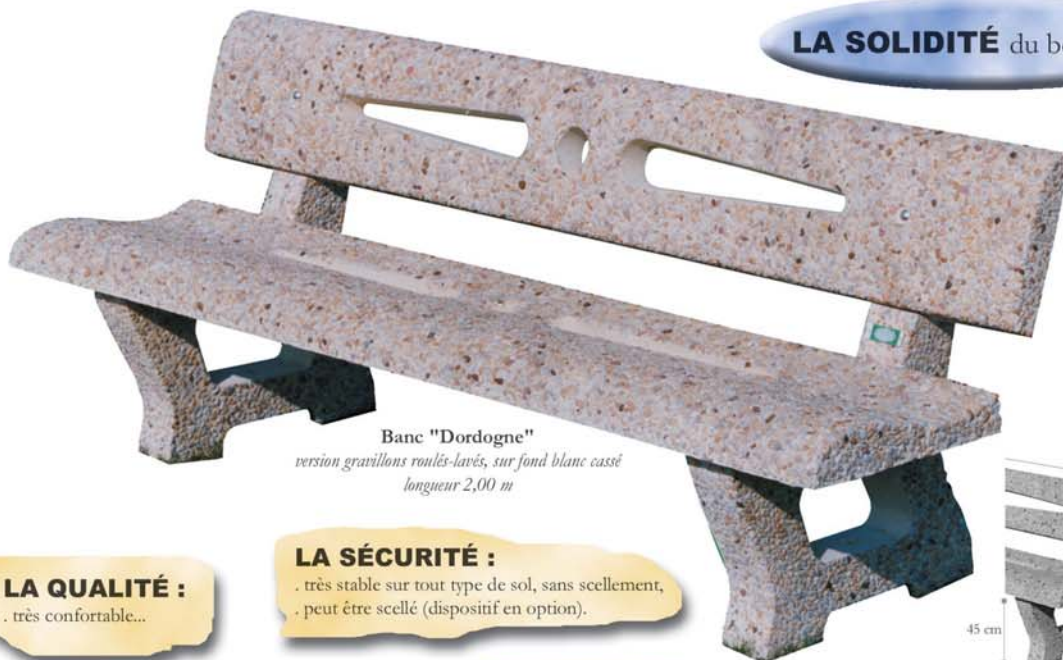
Banc "Dordogne" version gravillons roulés-lavés, sur fond blanc cassé longueur 2,00 m