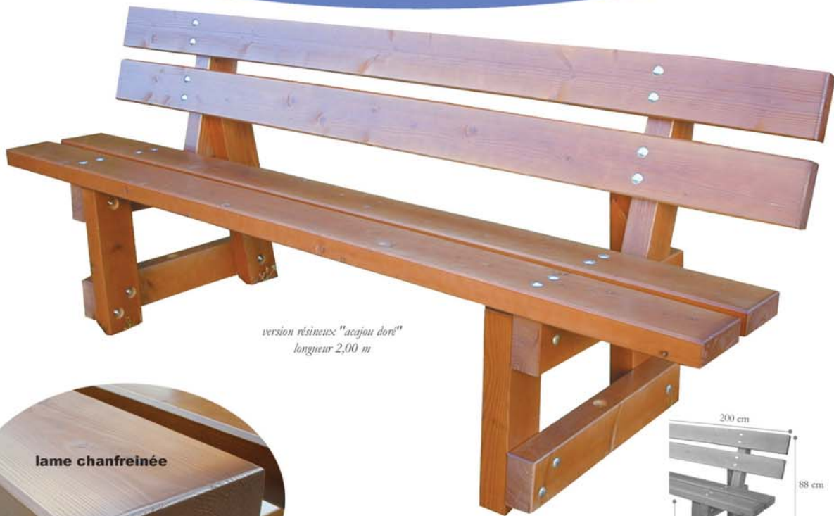
version résineux "acajou doré" longueur 2,00 m