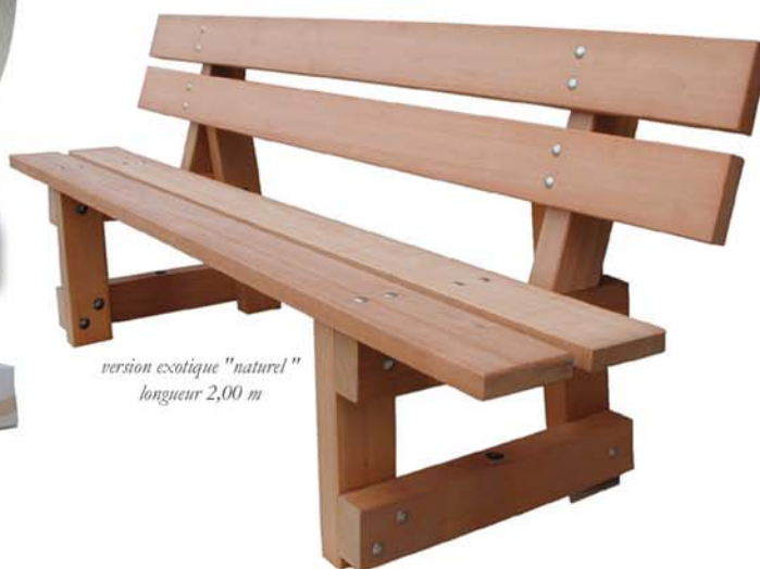
version exotique "naturel" longueur 2,00 m