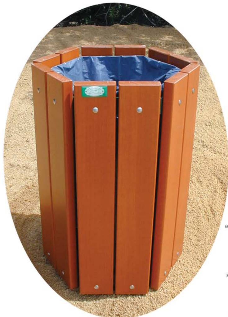
Corbeille "MAUREPAS" version exotique "acajou doré"