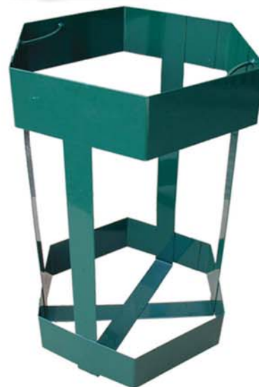
Panier receveur sac (type 50L) en acier laqué vert

sont poudrés en double couche avec des poudres agréées "Qualicoat" et "GSB", 100 % polyester cuisant à 210°/220°, assurant ainsi en extérieur, une protection maximale.