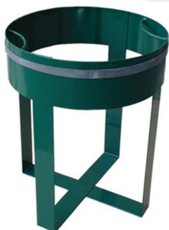
Panier receveur sac en acier laqué vert avec sandow de maintien.

Armature et porte-sac sont poudrés en double couche avec des poudres agréées "Qualicoat" et "GSB", 100 % polyester cuisant à 210°/220°, assurant ainsi en extérieur, une protection maximale.