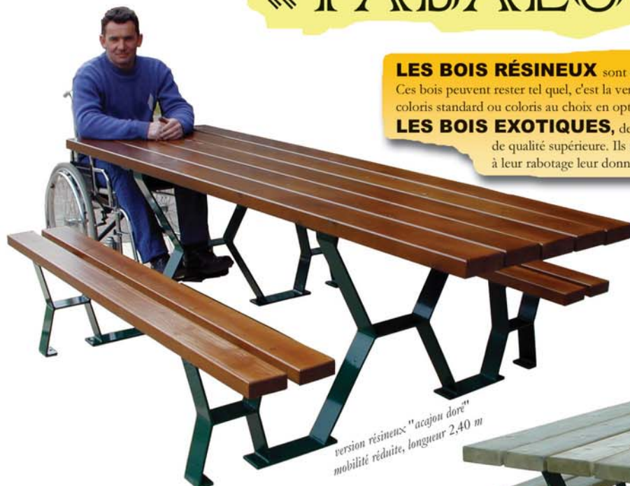
version résineux "acajou doré" mobilité réduite, longueur 2,40 m