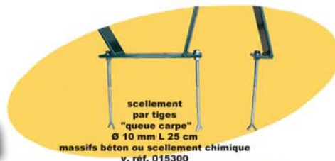
scellement par tiges "queue carpe" Ø 10 mm L 25 cm massifs béton ou scellement chimique v. réf. 015300

90 minutes suffisent hors scellement suivant notice accompagnant la quincaillerie. Les outils : une clé à pipe ou clé plate de 13.