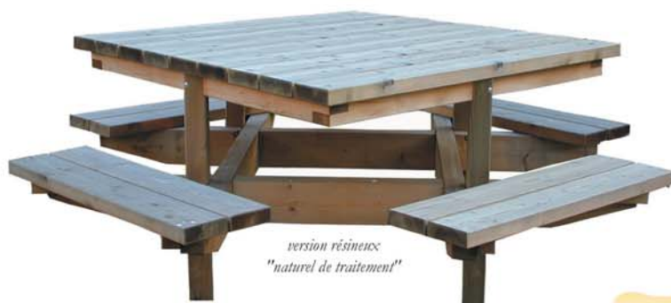
version résineux "naturel de traitement"