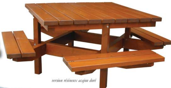
version résineux acajou doré

LES BOIS RÉSINEUX sont traités en autoclave sous forte pression, en station référencée par le Centre Technique du Bois et sont labellisés CTB.BOIS + (classe 3 pour les bois hors contact avec le sol et classe 4 pour les bois en contact permanent avec le sol). Ces bois peuvent rester tel quel, c'est la version "naturel de traitement", ou peuvent être lasurés en coloris standard ou coloris au choix en option.