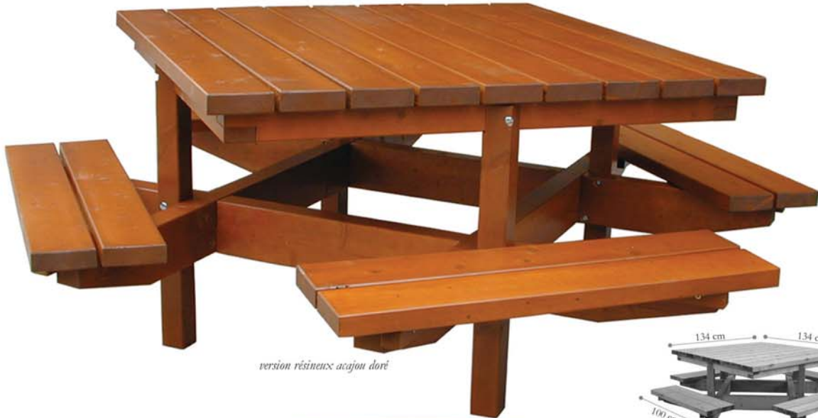
version résineux acajou doré