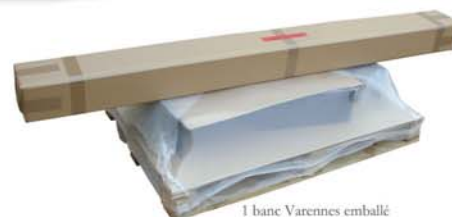
1 banc Varennes emballé

. chaque banquette est livrée en 2 colis, les pieds avec "la quincaillerie", dans un carton type CA double cannelure, et le jeu de lames dans une "boîte cloche" double cannelure assurant ainsi la meilleure sécurité durant les manutentions et le transport.