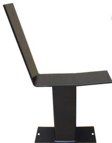
1 pied banc Varennes