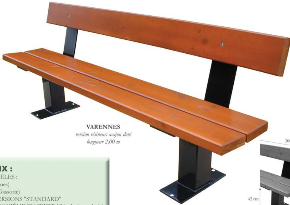
VARENNES version résineux acajou doré longueur 2,00 m