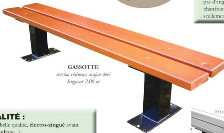
GASSOTTE version résineux acajou doré longueur 2,00 m