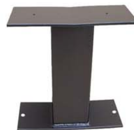
1 pied banquette Gassotte

profilé acier (tube carré de 120 ép. 3 mm et plat de 150 ép. 8 mm), sont électro-zingués, puis poudrés avec des poudres agrées "Qualicoat" et "GSB", 100 % polyester cuisant à 210°/220°, assurant ainsi en extérieur, une protection maximale. Couleur standard brun RAL 8022, ou autre couleur, en option, sur demande.