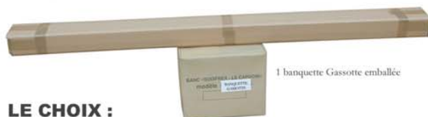
1 banquette Gassotte emballée